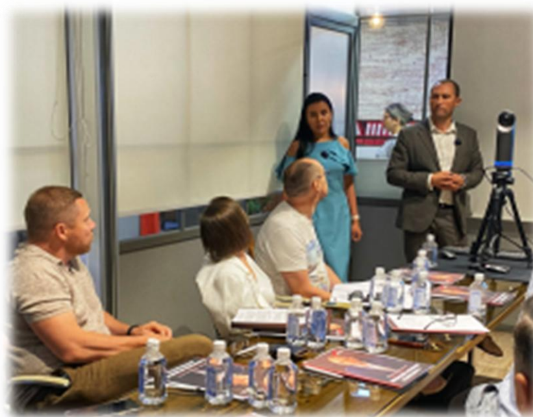
Налоговая реформа 24/25 от амнистии по «дроблению» до НДС на УСН.