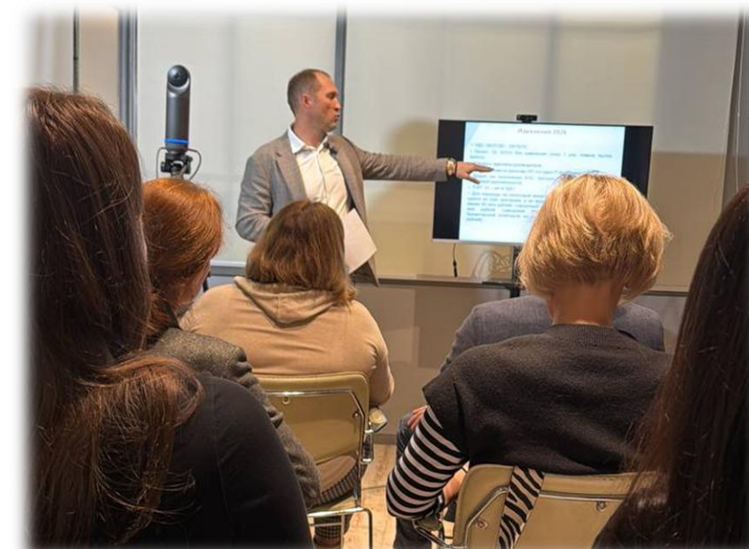
Практический бизнес-вечер «Антибанкротство.