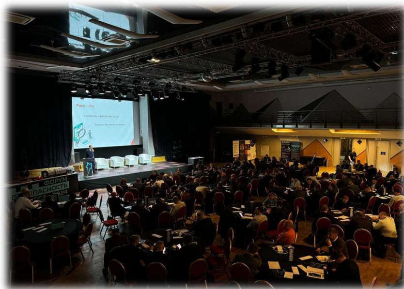
Бизнес-вечер «Налоговая перепрошивка- 2026»

Форматы проведения - от кратких докладов продолжительностью 20–30 минут до двухдневных обучающих семинаров.